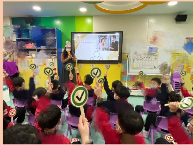
幼兒辨別情境圖的情況。