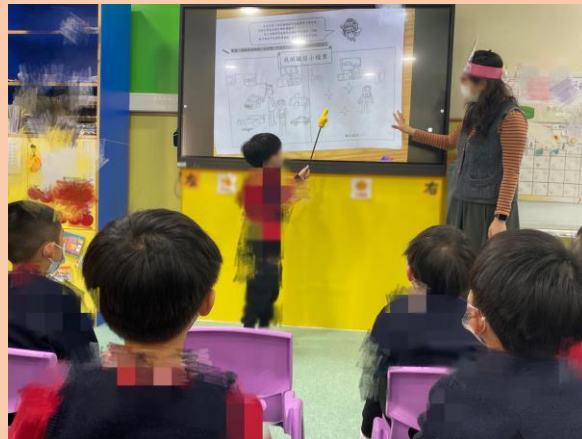
幼兒分享《我的誠信小檔案》。