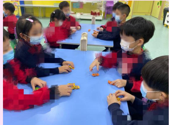
幼兒討論分享糖果的情形。