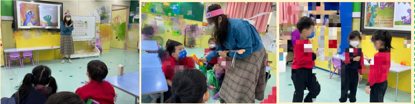
老師進行繪本閱讀的教學情形。