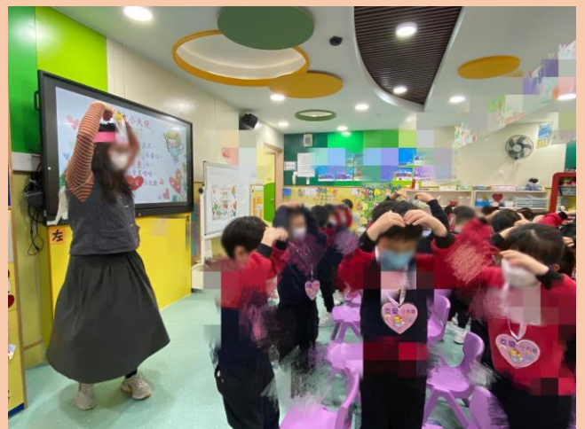
兒歌《友愛小天使》的配詞及朗讀情形。