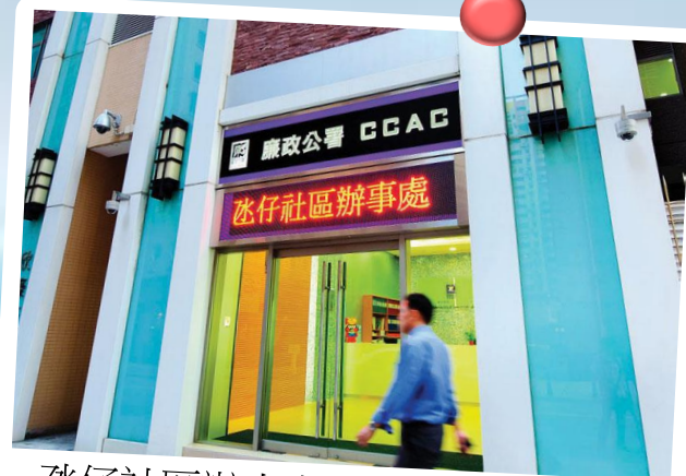
氹仔社區辦事處：氹仔南京街濠庭都會第四座地下 C 舖