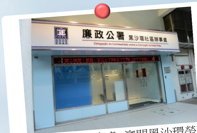
黑沙環社區辦事處：澳門黑沙環勞動節街 68-72 號裕華大廈地下