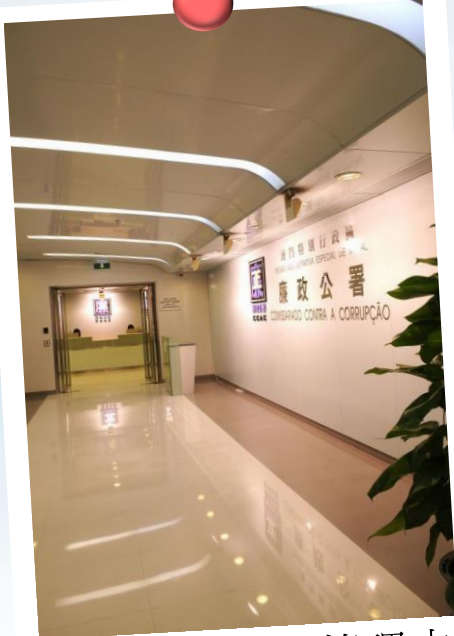
廉政公署投訴管理中心位於皇朝廣場14樓