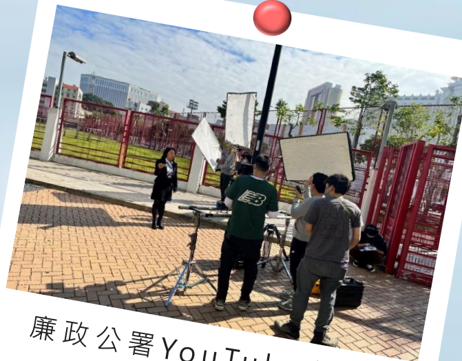
廉政公署 YouTube 頻道